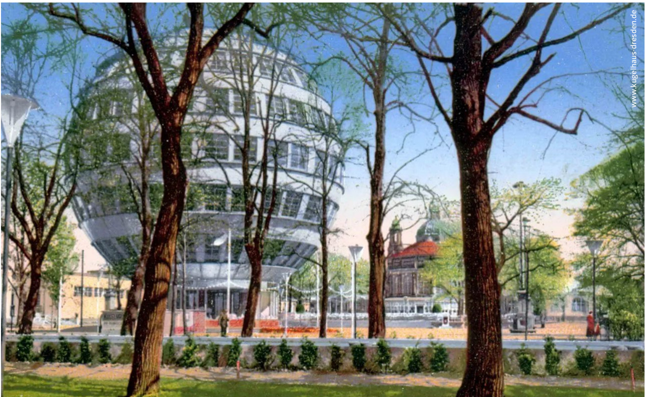
Kugelhaus im Großen Garten in Dresden anno 1931, das durch seine Form einen vergleichsweise geringen Wärmeverlust aufwies

Auch die Gebäude selbst können als Wärmespeicher betrachtet werden, die somit möglichst rund gebaut werden sollten. Ein Beispiel dafür sind die kuppelförmigen Iglus, für deren Form aber sicherlich die Statik ausschlaggebend ist. Das weltweit erste, 1928 errichtete Kugelhaus befand sich bis 1938 im Großen Garten in Dresden. Gegenwärtig bemüht sich ein Verein um den Bau eines neuen Kugelhauses an anderer Stelle. Bereits häufiger zu sehen sind Gebäude mit kreisrunder oder elliptischer Grundfläche, die schon einen gewissen Vorteil hinsichtlich des Oberflächen-zu-Volumen-Verhältnisses bieten.